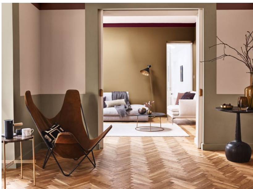
Achterkamer: Spiced Honey (Kleur van het Jaar 2019), baan aan het plafond Joyful Ruby, plafond Bright Star Voorkamer: Pink Nudity, Lively Kraft

Voor actuele kleurkaarten houdt je de kleurenprognoses van Pantone® en Flexa in de gaten. Voor 2019 hebben zij 'Living Coral' en 'Spiced Honey' tot kleuren van het jaar 2019 uitgeroepen. De kleur Spiced Honey is goed toe te passen bij het neerzetten van de sfeer en Flexa heeft verschillende kleurkaarten gemaakt waarbinnen deze kleur gecombineerd kan worden.