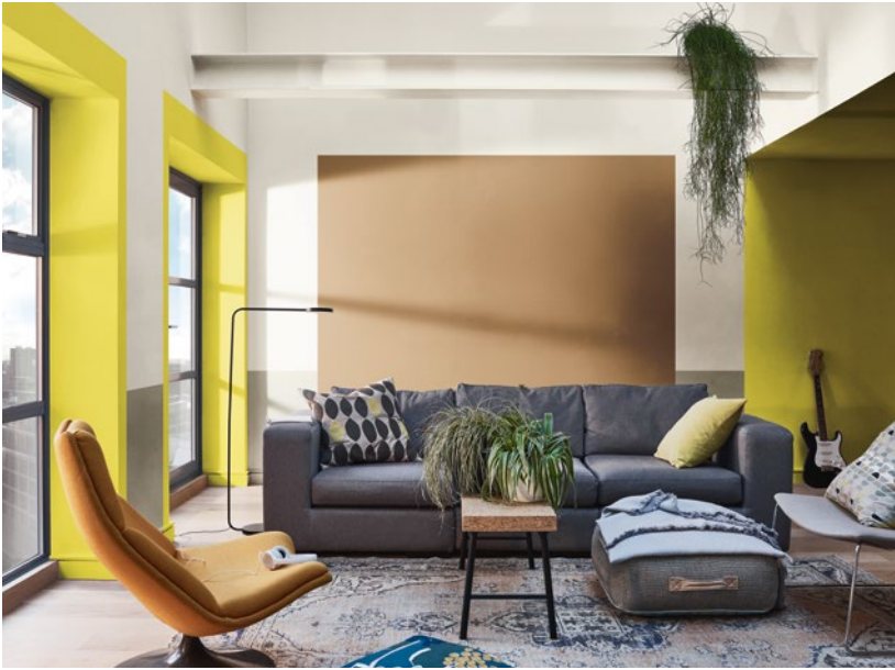
Achterwand: Spiced Honey (Kleur van het Jaar 2019) met eromheen JN.00.88 (wittint) Geel accenten G2.41.72