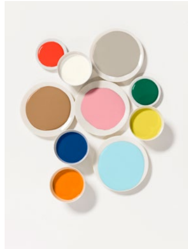
Van boven naar beneden, van links naar rechts: C5.57.42 – JN.00.88 – F6.04.63 Spiced Honey (Kleur van het Jaar 2019) – A5.11.61 – M3.47.29 – G2.41.72 (geel) U1.43.21 – E0.62.53 (oranje) – Q9.12.76 (lichtblauw)