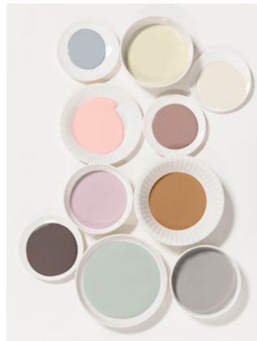
Van boven naar beneden, van links naar rechts: T4.04.66 – G5.07.77 – FN.01.79 B6.05.73 – Heart Wood X5.04.69 – Spiced Honey (Kleur van het Jaar 2019) C7.03.33 – LN.02.71 – ON.00.59