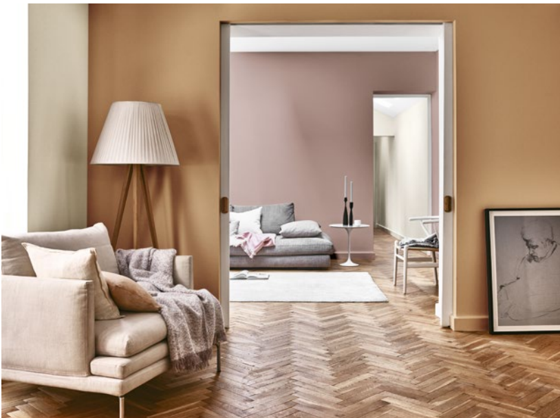
Achterkamer: Heart Wood (Kleur van het Jaar 2018), plafond FN.01.79 Voorkamer: Spiced Honey (Kleur van het Jaar 2019), G5.07.77