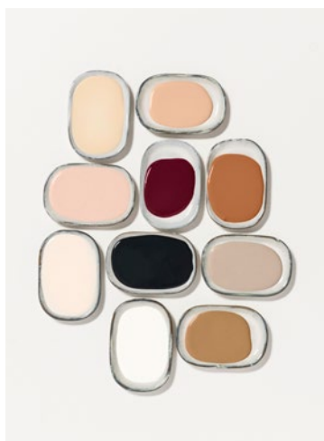
Van boven naar beneden, van links naar rechts: Warm Shell – Sun Kissed Pink Nudity – Joyful Ruby – Tasty Toffee Shimmered Love – Royal Blue – Lively Kraft Bright Star – Spiced Honey (Kleur van het Jaar 2019)